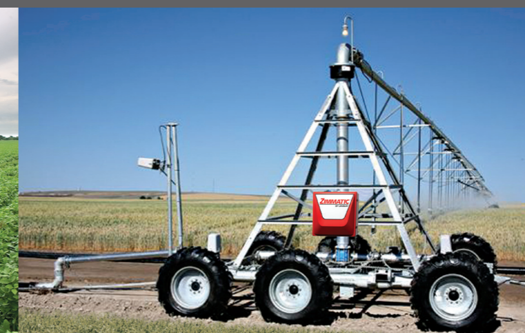
Plataforma de tração alta de seis rodas