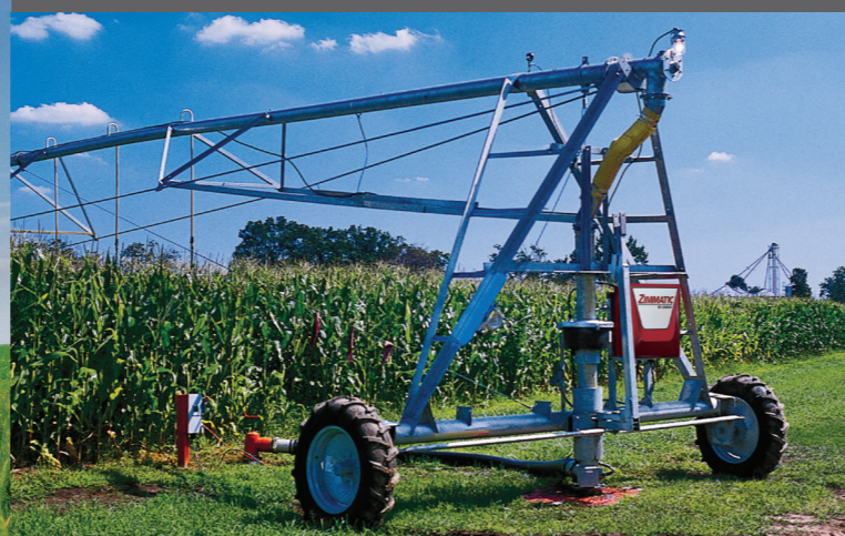
Pivô móvel de duas rodas