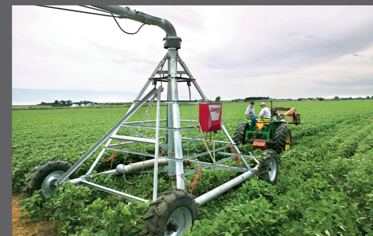
Pivô móvel de quatro rodas