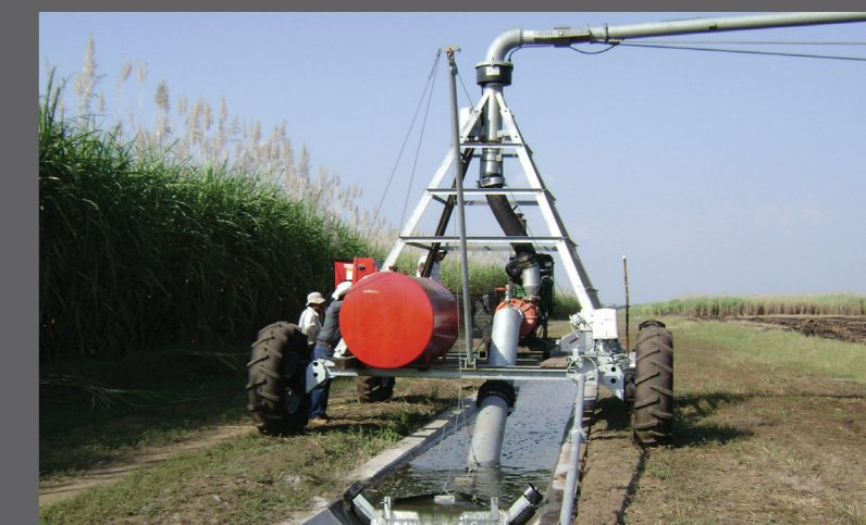
Opção alimentada por canal